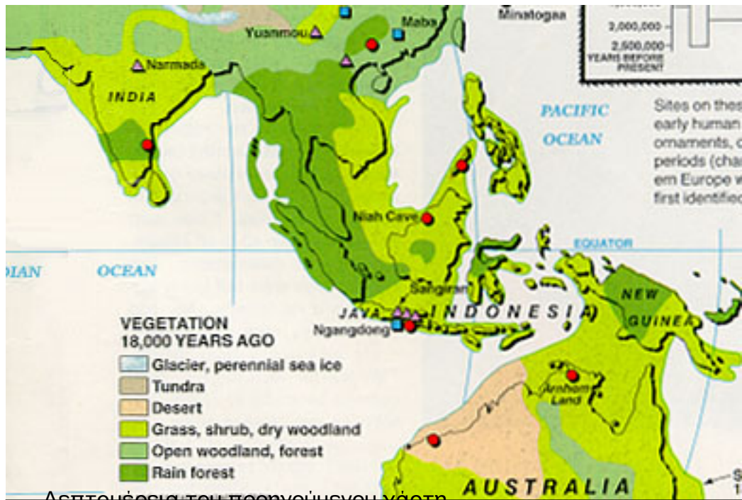
Λεπτομέρεια του προηγούμενου χάρτη.